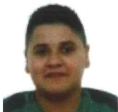
FRANCISCO XABIER SEVILLA SAVEDRA JARDUERA FISIKO EGOKITUA HASZTEN ELKARTEA PAÍS VASCO